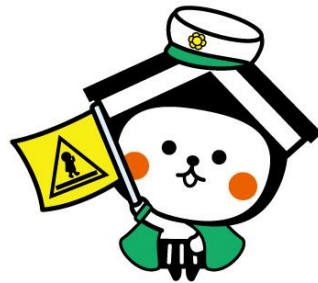
栃木市マスコットキャラクター とち介